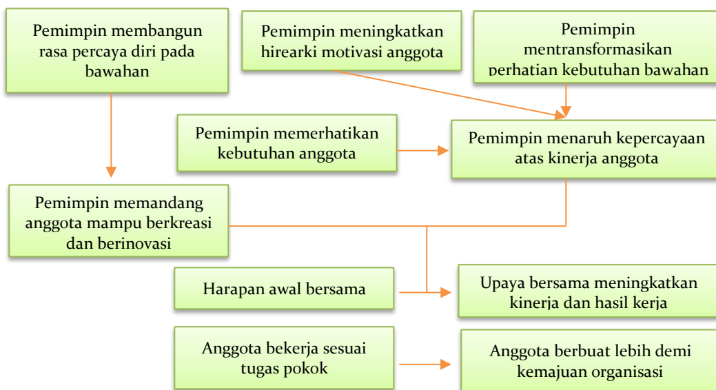
Gambar 1. Model Kepemimpinan Transformatif 24

Bass sebagaimana dikutip Aan dan Cepi, menampilkan model transformatif seperti skema berikut ini.