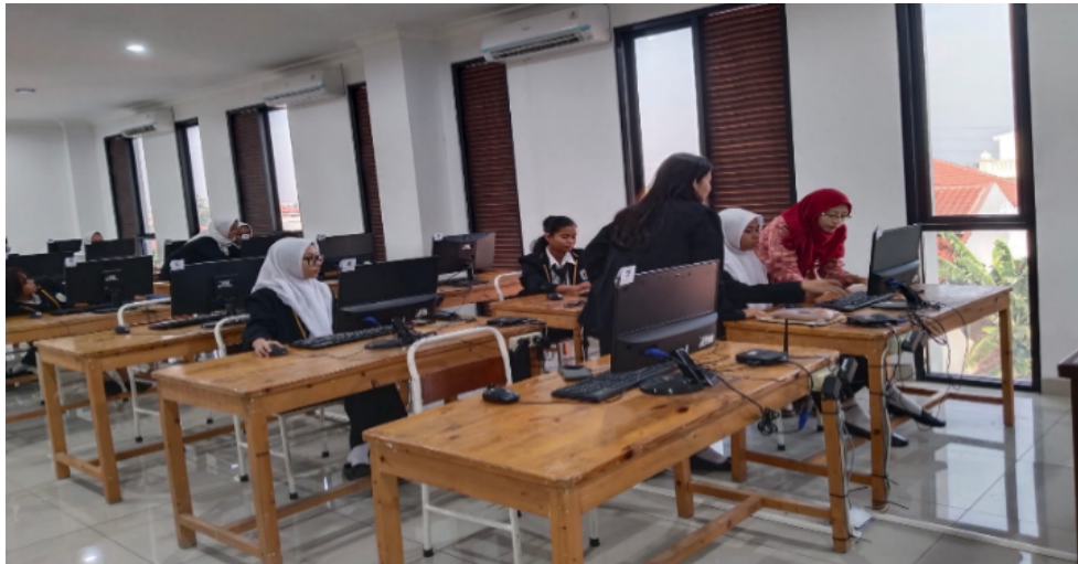
Gambar 2. Persiapan Pelatihan

dengan menggunakan Ms. Excel yang akan memberikan sebuah informasi berupa laporan keuangan untuk pengambilan keputusan manajemen.