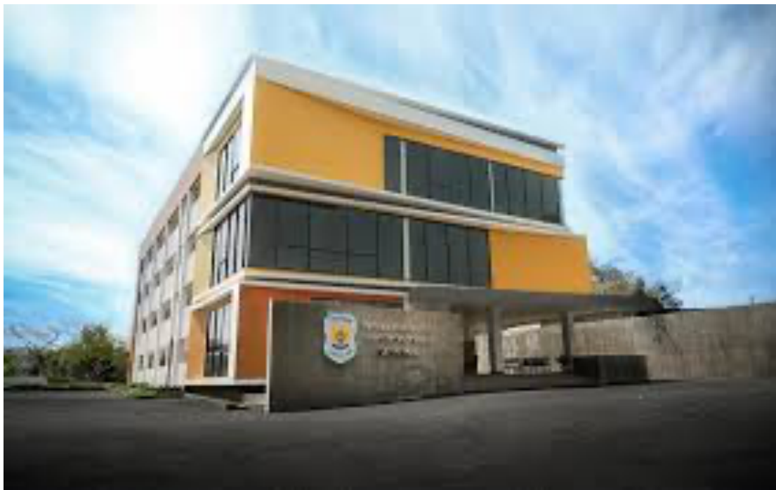
Gambar 1. Bangunan Gedung SMK Triguna

SMK Triguna 1956 merupakan Sekolah Menengah Kejuruan berlokasi di Petukangan Utara Jakarta Selatan mulai berdiri pada tahun 2008 berfokus pada pengembangan skill baik akademis maupun non akademis untuk mempersiapkan siswa dapat kompetitif menghadapi dunia kerja. Program jurusan yang dimiliki yaitu akuntansi dan manajemen perkantoran dikaji dari sisi entrepreneurship dan business innovation. Fasilitas yang dimiliki untuk mendukung proses belajar mengajar yaitu bangunan gedung yang kokoh seperti terlihat pada gambar 1, ruang praktik kerja serta laboratorium komputer maupun business center. Visi yang diemban SMK Triguna untuk mewujudkan sumber daya manusia yang bertakwa, produktif, berintegritas, berwawasan kewirausahaan, professional dan berdaya saing global.