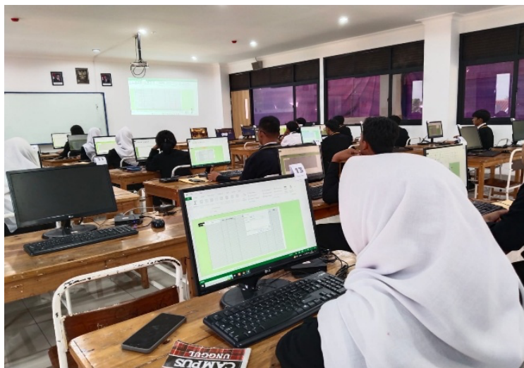
Gambar 3. Peserta Sudah Mempraktikkan

Adapun jadwal dan waktu setiap sesi kegiatan pelaksanaan sebagai berikut: