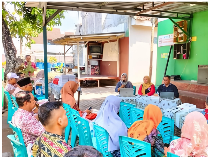
Gambar 4. Diskusi

Narasumber kedua dari Komisi Perlindungan Anak Indonesia Daerah (KPAID) memberikan pemahaman yang lebih mendalam mengenai mekanisme pelaporan kasus kekerasan terhadap anak. Beliau juga menjelaskan pentingnya peran masyarakat dalam mencegah dan menangani kasus kekerasan terhadap anak. Sesi tanya jawab pada sesi ini lebih fokus pada kasus-kasus yang sering terjadi di desa, seperti kenakalan remaja. Salah satu peserta bahkan berbagi pengalamannya terkait dengan masalah kenakalan remaja yang terjadi di lingkungannya.