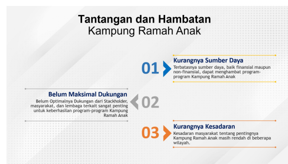
Gambar 3. Power Point: Materi

kesadaran kolektif. Perwakilan anak, seperti Forum Anak, sanggar anak, klub olahraga, dan kelompok sejenis, menjadi bagian penting agar suara dan kebutuhan anak dapat terwakili dengan baik. Di luar itu, pihak lain yang dianggap perlu, sesuai dengan kondisi dan kebutuhan wilayah, juga dapat dilibatkan untuk memperkuat pelaksanaan program. Dalam hal ini, mahasiswa PPL Bimbingan dan Konseling Islam UIN Sunan Kalijaga membantu proses administrasi dan dokumentasi selama berjalannya acara. Keterlibatan lintas sektor ini bertujuan menciptakan lingkungan yang aman, inklusif, dan mendukung tumbuh kembang anak secara menyeluruh.