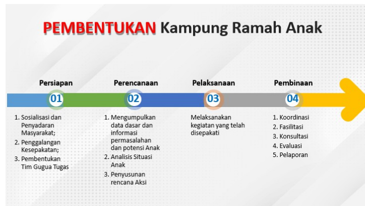
Gambar 2. Power Point: Materi