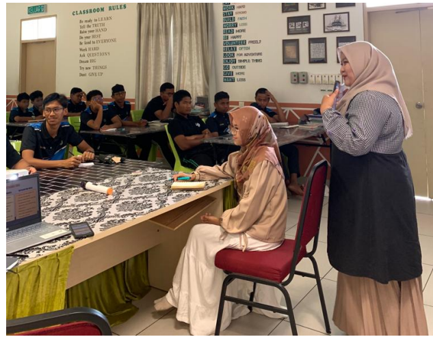
Gambar 1. Pemberian Permainan Batasan Diri