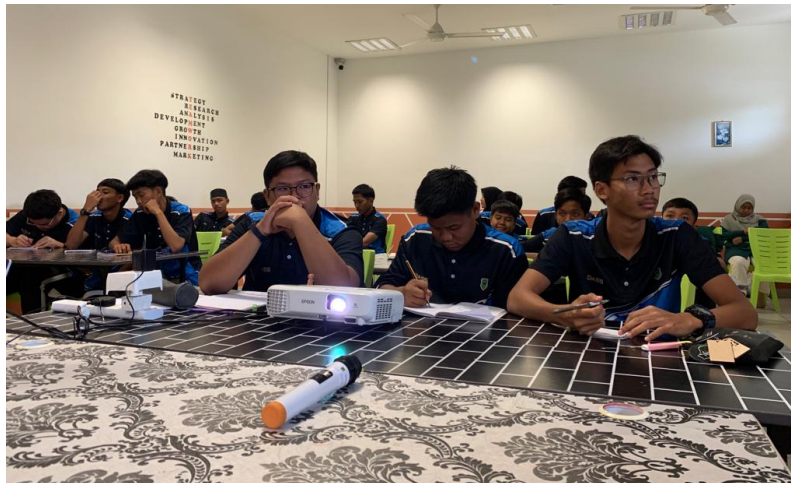
Gambar 2. Partisipan Bimbingan Klasikal