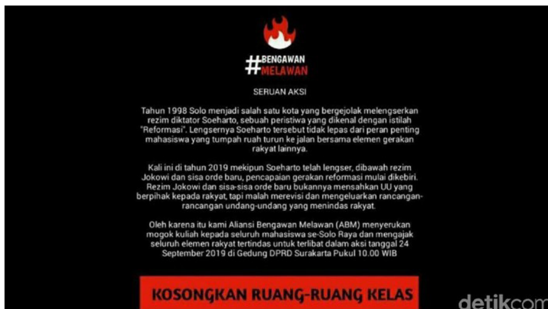
Sumber 3 : (Isnanto, 2019)