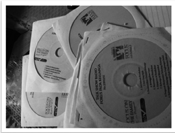
Gambar 3. CD Talk Show Masalah Keluarga yang disiarkan Radio Komunitas Suara Kerom Desa Asyaman

cang-bincang dengan bupati dan dengan SKPD setiap 1 minggu sekali.” (Wawancara dengan Penanggungjawab Rakom Suara Kerom, Lumbardus Warome, Juni 2014).