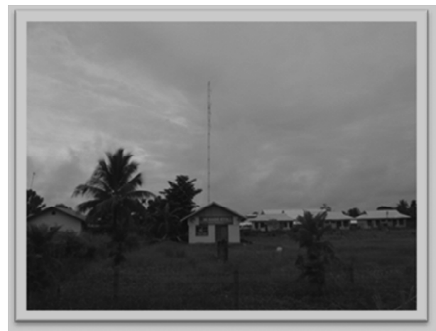
Gambar 2. Radio Komunitas Suara Kerom di Desa Asyaman Kecamatan Arso Kabupaten Kerom, Papua.

Radio komunitas yang berdiri di desa Asyaman, juga merupakan bantuan dari Kementerian Kominfo. Radio ini berdiri di desa Asyaman, Kecamatan Arso, Kabupaten Kerom, Provinsi Papua. Radio ini awalnya diberi nama Radio Komunitas Sumber Kasih yang kemudian berubah nama menjadi Suara Kerom. Radio ini juga memiliki motto 'Ini Radio Kita'.