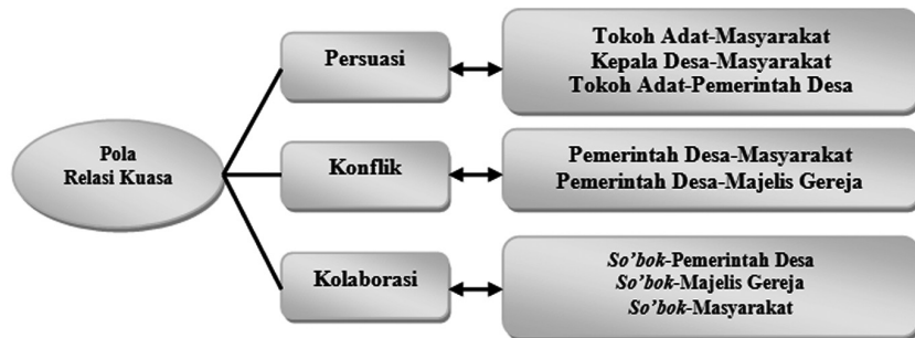
Gambar 2. Pola Relasi Kuasa Aktor Internal dalam Praktik Kelembagaan Pa'totiboyongan di Ballatumuka

Seperti yang telah dipaparkan sebelumnya, bahwa di dalam praktik pengelolaan sumberdaya pertanian berbasis kelembagaan lokal pa'totiboyongan di Ballatumuka, terdapat dua aktor utama yang berperan penting yaitu: aktor internal dan aktor eksternal. Aktor-aktor internal tersebut antara lain: masyarakat adat Ballatumuka, so'bok sebagai imam padi atau pemimpin pelaksanaan pa'totiboyongan , Kepala Desa Ballatumuka beserta aparat pemerintahan desa lainnya, serta majelis gereja sebagai perwakilan dari kelembagaan agama. Sementara itu, aktor-aktor eksternal yang keterlibatannya juga bernilai penting dalam pa'totiboyongan antara lain: masyarakat (luar) dan pemerintah daerah. Jika ditelaah dengan menggunakan kerangka atau pola-pola relasi kuasa Maring (2010), maka pada kasus relasi kuasa antar aktor internal yang terlibat langsung dalam pelaksanaan kelembagaan pa'totiboyongan di Ballatumuka, pola atau nuansa hubungan kekuasaan yang nampak adalah hubungan bernuansa persuasi, konflik, dan kolaborasi. Gambaran mengenai pola relasi kuasa yang tercipta dalam praktik pa'totiboyongan di Ballatumuka dapat dilihat pada bagan di bawah ini.