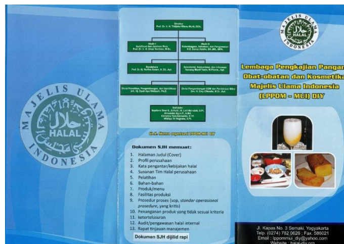
Gambar 3. Halaman brosur LPPOM-MUI yang memuat format dokumen dokumen SJH.

Selain itu, pada acara penyuluhan disampaikan pula teknik penyembelihan ayam potong yang sehat dan benar sesuai syariat Islam. Rincian materinya meliputi: