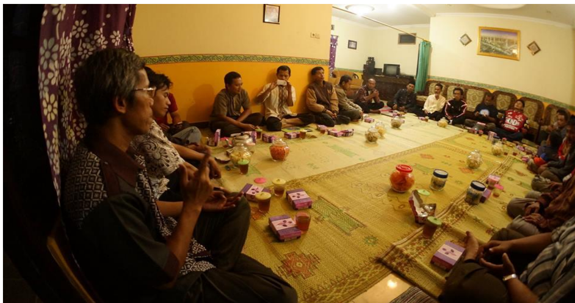
Gambar 5. Suasana penyuluhan proses sertifikasi halal hasil penyembelihan rumah potong ayam (RPA) untuk anggota kelompok ternak unggas “Mitra Harapan Turi” Dusun Garongan Wonokerto Turi Sleman Yogyakarta.

Materi penyuluhan meliputi manfaat dan proses sertifikasi halal suatu produk, khususnya produk RPA, serta materi mengenai teknik penyembelihan ayam potong yang sehat dan halal sesuai dengan syariat Islam. Peserta mendengarkan materi tersebut dengan serius. Selain karena materi tersebut merupakan pengetahuan baru bagi mereka, mereka juga memperoleh motivasi dalam mengembangkan bisnis mereka. Suasana penyuluhan dapat dilihat pada gambar 5.