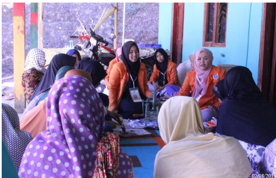
Gambar 2. Kegiatan Pengolahan Umbi Talas Menjadi Tepung Talas