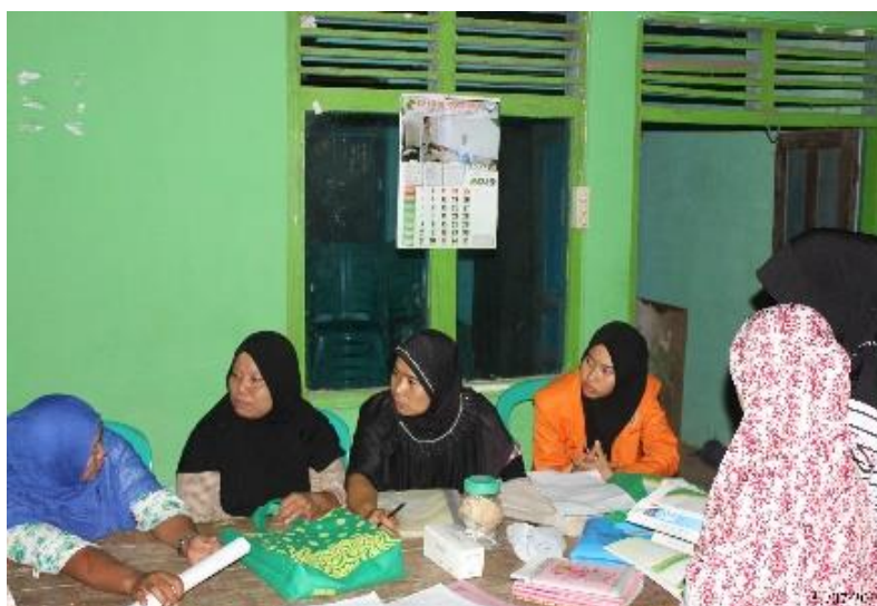
Gambar 6. Kegiatan Pendampingan Pengurusan P-IRT

Sebelum dilakukan pemasaran produk harus mendapatkan ijin kelayakan dari pemerintah. Ijin ini dilakukan agar standarisasi pasar terjaga dan masyarakat aman dalam mengkonsumsinya. Ijin ini diperoleh dari dinas kesehatan setempat. Produksi dibagi menjadi 2 yaitu produksi menengah keatas dan menengah kebawah. Khusus untuk produk kecil disebut dengan perijinan pangan industri rumah tangga atau yang disebut PIRT. Dengan sertifikat ini produk telah melewati berbagai studi kelayakan atau pengecekan yang standarisasi. Sehingga kelompok wanita dan ibu-ibu pengolah talas mendapatkan pendampingan untuk pengurusan P-IRT (Gambar 6). Berdasarkan kunjungan dinas kesehatan di rumah produksi Dusun Padangan, terdapat beberapa perbaikan supaya nomor ijin edar P-IRT bisa dikeluarkan.