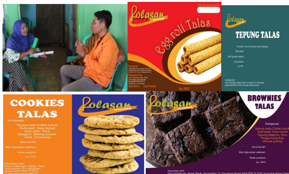
Gambar 4. Pelatihan Pengemasan dan Labelling serta Label Produk Talas

Kegiatan pemberdayaan ini selain bertujuan untuk menghasilkan produk olahan talas juga mengangkat nilai jual produk tersebut. Sehingga masyarakat juga diberikan bekal terkait pengemasan dan labelling untuk mempersiapkan penjualan produk di luar daerah. Kegiatan pelatihan pengemasan diberikan dalam bentuk penyampaian materi terkait bahan kemasan yang diperbolehkan untuk bahan pangan dan makanan serta dasar memilih bahan kemasan untuk jenis pangan dan makanan tertentu. Masyarakat juga diberikan pelatihan terkait penyusunan label yang sesuai dengan aturan yang berlaku sehingga bisa mendapatkan izin edar produk di pasaran. Kegiatan pelatihan dan pendampingan tersebut menghasilkan 4 buah label yaitu label tepung talas, cookies talas, brownies talas, dan egg roll talas (Gambar 4).