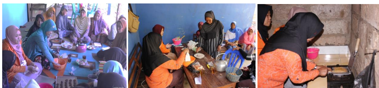
Gambar 3. Pelatihan Pembuatan Cookies , Brownies Kukus, dan Egg Roll Talas

Hasil Survei Sosial Ekonomi Nasional 2015 (SUSENAS) yang menunjukkan bahwa konsumsi sebagian besar makanan jadi mengalami peningkatan. Peningkatan konsumsi per kapita per tahunnya terlihat pada makanan jadi salah satunya kue kering/biskuit/semprong/ cookies yang mengalami kenaikan terbesar kedua (24.22%) setelah lontong/ketupat sayur (26.15%) (Anonim, 2015). Di sisi lain, aneka kue kekinian ala artis mulai menjamur dan tersebar di seluruh Indonesia hingga berjumlah kurang lebih 75 jenis (Susanto and Harahap, 2017). Sehingga diversifikasi olahan tepung talas yang dipilih adalah brownies kukus, egg roll , dan cookies talas yang bisa menjadi icon kuliner khas daerah wisata di Desa Nglegi.