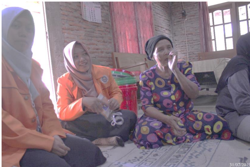
Gambar 5. Pelatihan dan Pendampingan Pemasaran