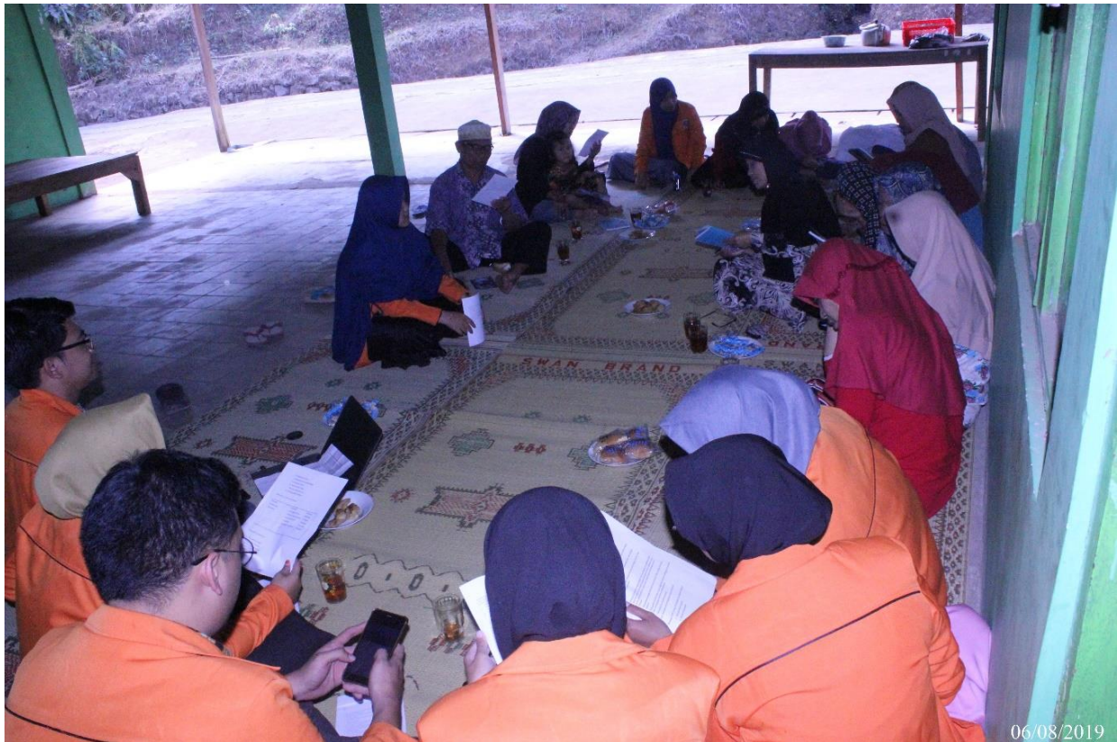
Gambar 1. Kegiatan Pelatihan Keamanan Pangan

Tangga (CPPOB-IRT) sebagai bekal masyarakat dalam menjaga keamanan pangan dari produk yang dihasilkan. Kedua hal tersebut juga membantu dalam mempersiapkan aspek-aspek untuk mendukung pengurusan P-IRT.