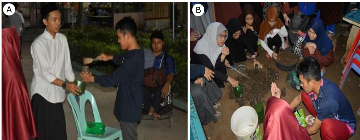
Gambar 4. (A) Pembuatan Ni-MOL Bersama Warga Pesantren, (B) Intervensi Vertikultur sebagai Tindak Lanjut Pengolahan Sampah

Intervensi ini dilakukan dalam merespon banyaknya sampah yang berhasil dipilah dalam kegiatan pengelolaan sampah. Sampah botol dan plastic masih dapat diberdayakan sebagai media untuk vertikultur. Selain itu vertikultur yang dibuat diperbaiki dengan menggunakan kantong-kantong dari terpal. Pertimbangan membuat media tanam vertikultur yaitu dikarenakan lokasi KKN memiliki tanah yang sulit dalam menyerap air dan juga memiliki unsur hara yang sedikit, sehingga intervensi yang dilakukan termasuk dengan adanya sosialisasi jenis dan unsur tanah sebagai syarat dalam pembuatan vertikultur dan pupuk untuk penghijauan dari bahan sampah. Pupuk yang dibuat oleh warga pesantren adalah diberi nama NI-MOL (Norol Iman Mikroorganisme Lokal). Pemilihan nama ini karena dalam pembuatannya menggunakan buah local yang dibusukkan dan media tanah local.