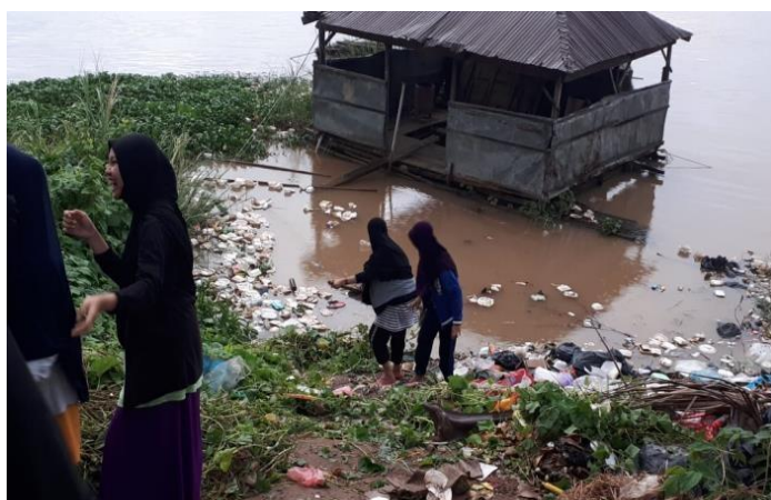
Gambar 2 Identifikasi Persoalan Lingkungan yang Perlu Intervensi

Penyebab para santri masih sering membuang sampah di tepi sungai karena tidak adanya bantuan dari pemerintah setempat dalam menyediakan lahan untuk pembuangan akhir. terlebih hal itu juga diperparah dengan pembuangan sampah yang dipilah terlebih dahulu. Jadi, sampah baik berupa organik, plastik dan lain sebagainya sama akhirnya dibuang dibantaran sungai. Hal tersebutlah yang membuat peneliti tertarik untuk melakukan penelitian di Madrasah Norol Iman. Selain itu, lokasi tersebut sesuai dengan topik yang diangkat yaitu peningkatan pengetahuan dan keterampilan pengelolaan lingkungan di komunitas muslim Kamboja. Pengolahan Sampah (Reduce, Reuse, Recycle) dan Penghijauan Sebagai Sebuah Intervensi