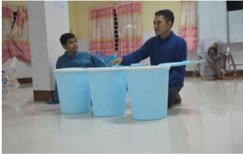
Gambar 3. Mewarnai Tong Sampah sebagai Pondasi Pengetahuan Mengenai Reduce, Reuse, Recycle.

membuang sampah, seperti di dapur dan halaman taman. Selain dengan mengajak warga madrasah untuk mewarnai tong sampah, dilakukan juga sosialisasi pengolahan sampah untuk melihat aspek pengetahuan warga pesantren.