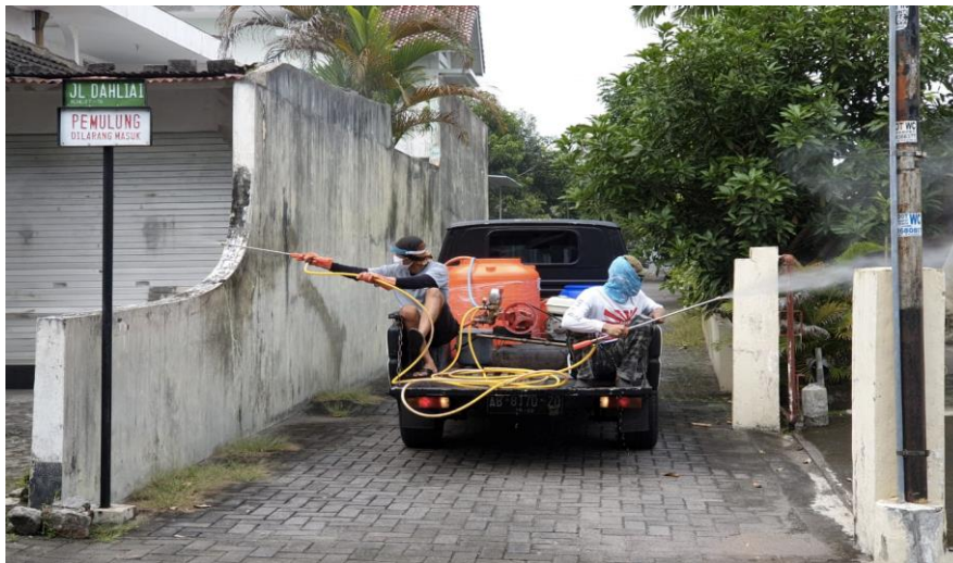
Gambar 4. Penyemprotan Disinfektan di Lingkungan Perumahan Sawitsari

penyemprotan disinfektan dilakukan di lingkungan perumahan. Penyemprotan tersebut dilakukan di depan rumah warga, pagar dan jalan-jalan utama.