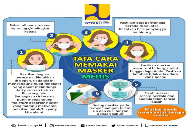
Gambar 6. Sosialisasi Pemakaian Masker yang Benar

Sosialisasi menggunakan masker pada anak-anak di lingkungan Sawitsari juga dilakukan. Hal ini disebabkan karena anak-anak keluar rumah untuk bermain tidak menggunakan masker dengan benar. Mereka keluar rumah dan bermain di lingkungan mereka seringkali menggunakan masker tetapi seringkali tidak masker dikenakan di bawah dagu. Saat dikonfirmasi terkait hal tersebut mereka menjawab menggunakan masker membuat mereka tidak bisa bernafas. Melihat realitas seperti itu, maka tim pengabdian memberikan informasi cara pemakaian masker yang benar (Gambar 6) dan juga kesalahan-kesalahan menggunakan masker dengan mengacu pada Komite Penanganan Covid-19 dan Pemulihan Ekonomi Nasional (2020)