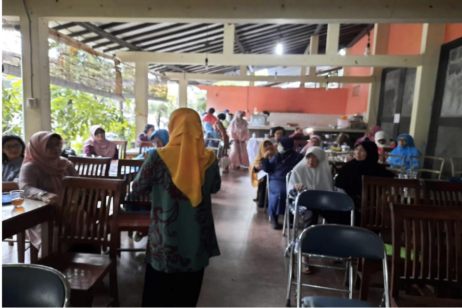
Gambar 2. Pertemuan Paguyuban Perempuan Sawitsari

Pada pertemuan tersebut diinformasikan tentang Covid-19 dan bahayanya serta kelompok-kelompok yang rentan, seperti lansia, yang memiliki riwayat penyakit seperti, diabetes dan hipertensi. Selain itu juga diinformasikan tentang pentingnya menjalankan protokol kesehatan Covid-19 dengan cara menggunakan masker, mencuci tangan, dan menjaga jarak. Informasi tersebut diperoleh dari narasumber yang berprofesi dokter di salah satu rumah sakit di Yogyakarta.