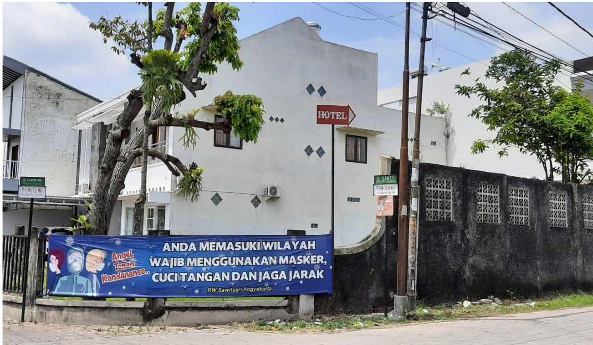
Gambar 3. Sosialisasi Melalui Spanduk