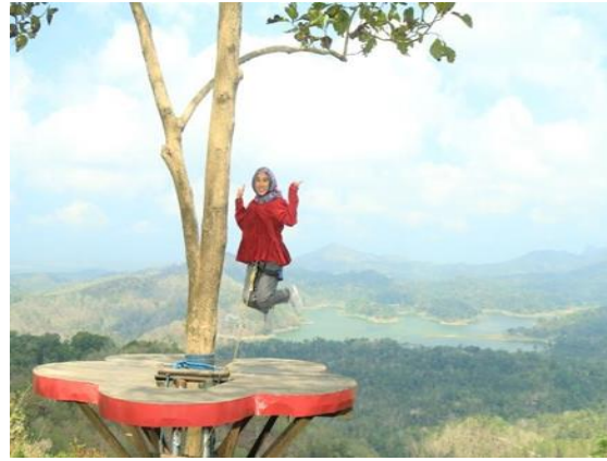
Gambar 5. Spot Bunga