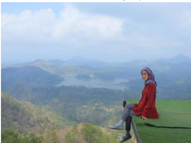
Gambar 6. Take Video Spot Pangung