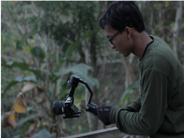
Gambar 2. Pengambilan Video