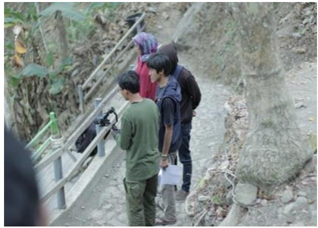
Gambar 3. Koordinasi dengan penjaga spot