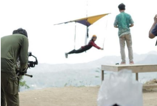
Gambar 4. Shoot Video spot gantole