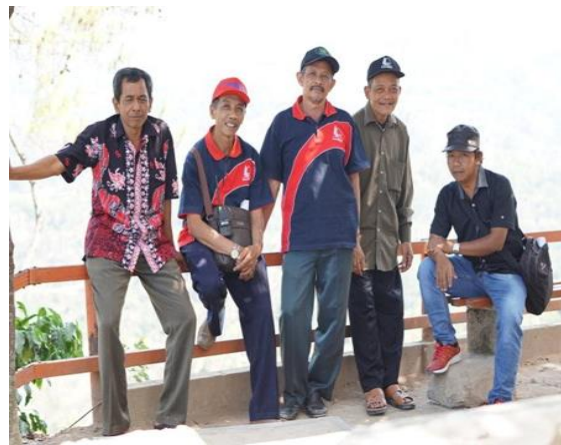
Gambar 7. Tokoh Pendiri wisata Kali Biru