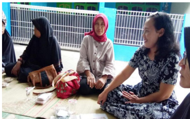
Gambar 1. Pengenalan Urban Farming dalam pertemuan warga, Januari 2020.

Penyampaian pesan via WAG dikombinasikan dengan video pendek tentang urban farming yang sudah dipraktekkan oleh kelompok-kelompok masyarakat lain sebagai contoh aplikasi urban farming . Dengan fiti ini diharapkan warga atau mitra menjadi lebih tertarik untuk mengembangkan urban farming di dalam komunitasnya. Setelah dipraktekkan, media fiti cukup efektif membangkitkan semangat warga untuk belajar bertanam mandiri.