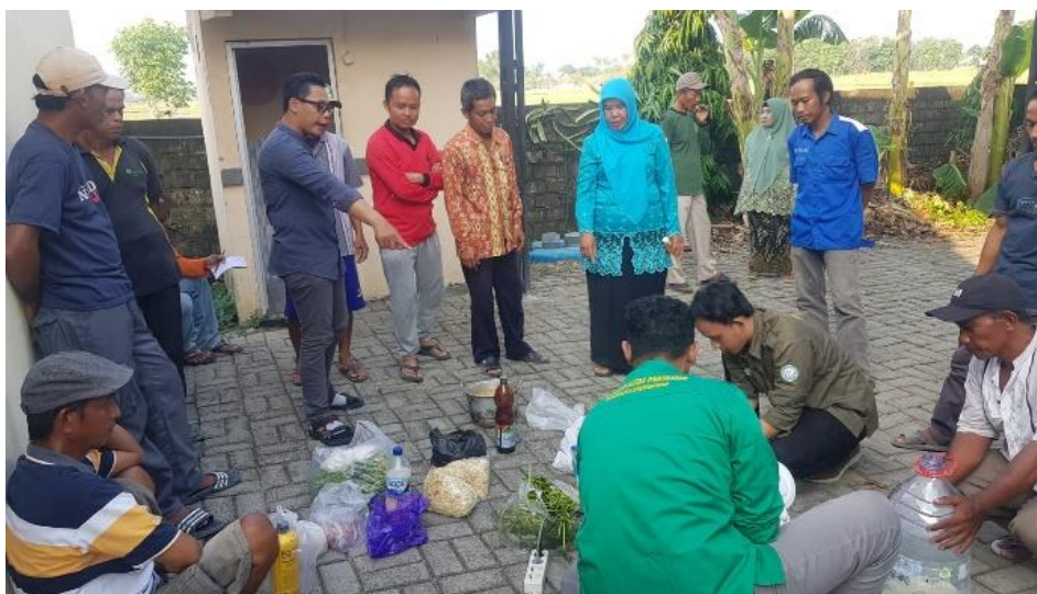
Gambar 4. Demonstrasi Proses Pembelajaran Pembuatan Pupuk Organik Cair pada Masyarakat

Penyampaian materi pelatihan yang kami sampaikan menjelaskan terkait pengolahan sampah berbasis rumah tangga yang dapat dimanfaatkan sebagai pupuk organik cair. Tujuan dari penjelasan ini adalah untuk memberikan pemahaman dan pengetahuan secara umum mengenai manfaat pupuk organik cair dan bagaimana cara membuat secara mandiri kepada audiens sehingga dapat memahami konsep pelatihan secara keseluruhan. Pemaparan materi dilanjutkan dengan pengenalan berbagai jenis pupuk organik cair, bahan pupuk organik cair, dan proses produksi pupuk organik cair. Penjelasan teknis pembuatan dan demonstrasi praktik pembuatan pupuk organik cair dijelaskan kepada masyarakat dengan beberapa contoh bahan yang disiapkan oleh tim, dengan tujuan agar Masyarakat dapat melihat secara langsung proses pembuatan pupuk organik cair yang ditunjukkan pada Gambar 4.