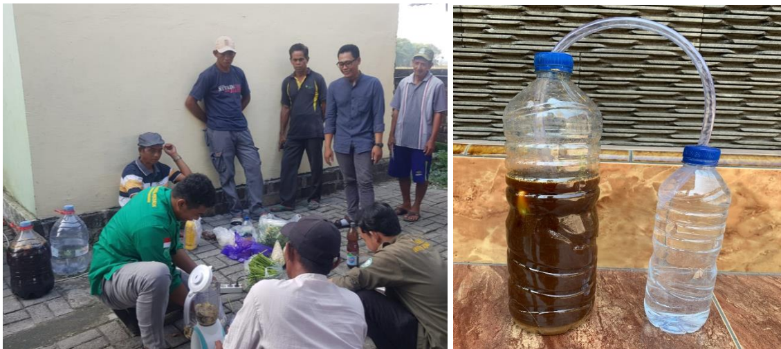
Gambar 5. Praktik Pembuatan dan Contoh Hasil Produk Pupuk Organik Cair yang Dilakukan oleh Mitra

rumah tangga yang telah dikumpulkan beberapa hari sebelum pelaksanaan pelatihan seperti yang ditunjukkan pada Gambar 5.