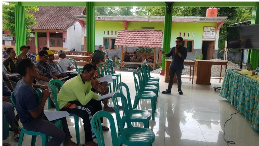
Gambar 3. Sosialisasi Penanganan Sampah Terpadu berbasis Masyarakat yang Dilakukan oleh Tim PKM

Kegiatan PKM diawali dengan melakukan sosialisasi melalui diskusi cara penanganan sampah terpadu berbasis Masyarakat. Pendekatan yang dilakukan didasarkan pada kebutuhan dan permintaan Masyarakat dan inisiasi dari pemuda Paguyuban Danyang Pemuda desa Banggle. Gambar 3 merupakan bentuk sosialisasi yang dilakukan oleh Tim PKM pada Masyarakat dan pemuda Paguyuban Danyang Pemuda desa Banggle