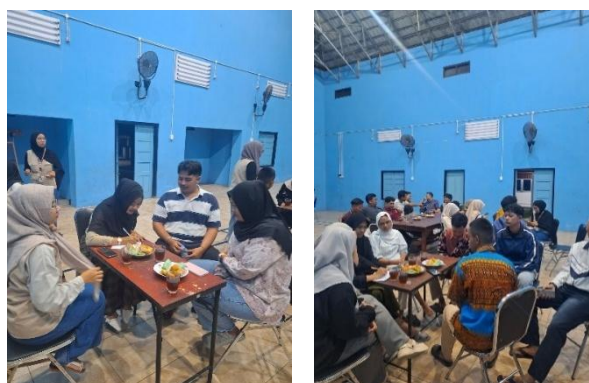
Gambar 2. Peserta membentuk FGD dan saling berdiskusi

Di awal rangkaian kegiatan psikoedukasi, peserta diminta untuk mengidentifikasi gaya ekspresi kasih sayang yang mereka miliki melalui tes sederhana yang melibatkan kesadaran penuh peserta mengenai keseharian mereka. Setelah peserta mengenal bahasa cinta masing-masing, peserta diarahkan untuk membentuk suatu kelompok diskusi sesuai dengan bahasa cinta yang mereka miliki, yakni words of affirmation , quality time , receiving gifts , acts of service , dan physical touch . Dalam agenda FGD, peserta diberi suatu study case , dimana salah satu teman mereka sedang mengalami stres atau situasi yang menyulitkan. Dari kondisi tersebut, peserta pada tiap kelompok diminta untuk mengekspresikan diri menyampaikan kepeduliannya sesuai dengan gaya bahasa cinta yang dimiliki dengan menuliskannya selangkah demi selangkah pada selembar kertas. Dari study case tersebut, para peserta pada masing-masing kelompok saling berdiskusi untuk menentukan apa saja yang dapat dilakukan ketika menghadapi situasi tersebut. Di akhir FGD, setiap kelompok akan menjelaskan mengenai ide pada masing-masing kelompok sesuai dengan bahasa cintanya masing-masing.