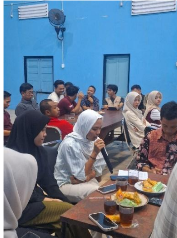
Gambar 4. Peserta menyampaikan hasil diskusi FGD mengenai study case

tangan. Dengan mempraktekkan cara untuk mengekspresikan bahasa cinta sesuai dengan preferensi diri sendiri, peserta dapat lebih mengerti bagaimana cara untuk mencintai orang lain dan membuat diri sendiri merasa dicintai (Azzahra, et. al., 2024). Setiap kelompok berkreasi dan berkeaktivitas untuk menemukan jawaban yang mendukung juga peduli dalam situasi study case yang telah diberikan sebelumnya.