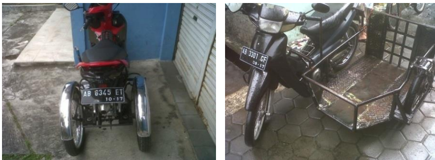
Gambar 6 Sepeda motor hasil modifikasi

Beberapa faktor yang menyebabkan para difabel memiliki kendaraan modifikasi diantaranya kualitas angkutan umum yang belum memadai bagi para difabel, tuntutan aktivitas dan juga kondisi ekonomi. Selain sepeda motor modifikasi, beberapa dari penyandang difabilitas juga ada yang menggunakan sepeda modifikasi untuk mendukung aktivitas mereka