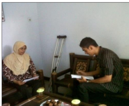
Gambar 5 Wawancara dengan pengguna kruk dan kursi roda

Jika dibandingkan dengan Trans Jogja, Bus Kota lebih tidak nyaman bagi para difabel yang memanfaatkan selama perjalanan. Hal ini dikarenakan di dalam bus kota belum ada tempat khusus yang disediakan bagi penumpang difabel, sehingga mereka harus diangkat untuk duduk di kursi penumpang dan kursi rodanya dilipat. Bagi para difabel, hambatan di dalam mengakses Bus Kota adalah pada saat akan menaiki bus dan pada saat turun dari bus. Hal itu dikarenakan untuk naik ke bus kota yang terlalu tinggi dan tidak seperti menaiki Trans Jogja yang mana shelter dan lantai bus sama tinggi.