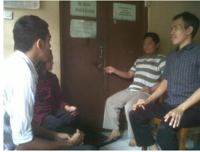
Gambar 8 Wawancara dengan Penyandang Tuna Netra