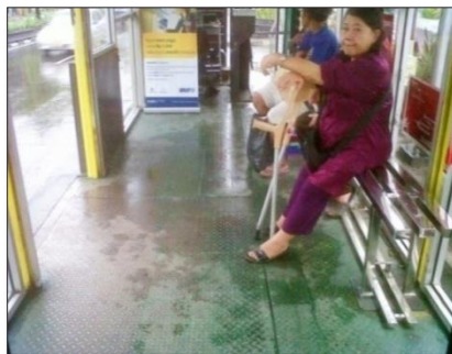
Gambar 3 Penumpang Trans Jogja Pengguna Kruk

Tidak semua bus Trans Jogja dilengkapi dengan tempat khusus bagi para penumpang difabel. Untuk bus Trans Jogja yang tidak memiliki space khusus tersebut, penumpang difabel terpaksa berhimpit-himpitan dengan penumpang lain. Peneliti juga melakukan wawancara kepada penumpang Trans Jogja pengguna kruk terkait tanggapan mereka yang pernah mengakses Trans Jogja. Ternyata penumpang pengguna kruk juga mengalami kesulitan saat mengakses Trans Jogja.