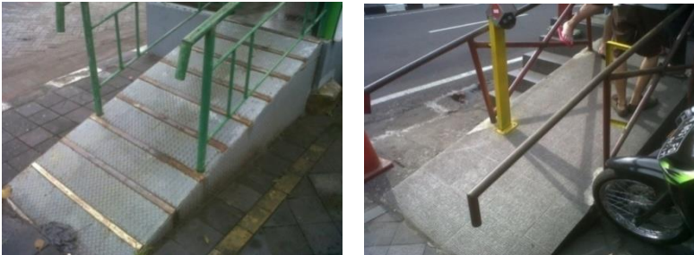
Gambar 2 Kondisi ramp yang masih curam

Selain karena keadaan ramp yang curam, jarak antara lantai bus dan shelter masih terlalu renggang, sehingga bagi para pengguna kursi roda harus dibantu (diangkat) pada saat naik ke shelter maupun pada saat masuk ke dalam bus.