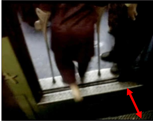
Gambar 4 Gap Platform

dengan yang pakai kursi roda, hambatannya paling pas naik ke bus itu jarak antara bus dan lantai shelter masih renggang, terkadang minta bantuan juga..." (PJ, pengguna kruk)