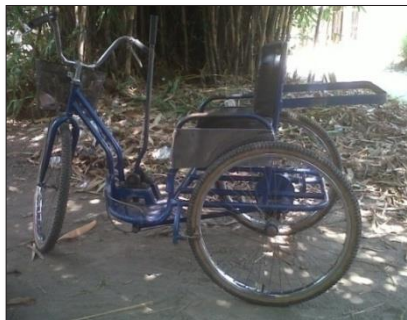
Gambar 7 Sepeda hasil modifikasi

"Mobil saya itu bukan modifikasi mas, tapi udah pakai matic, itu kan udah dari pabrikannya langsung. Mobil modifikasi saya sudah saya jual soalnya kalau dibandingkan dengan mobil matic, mobil modifikasi itu sulit mas gunainnya, nggak simpel ..." (TD, pengguna kruk).