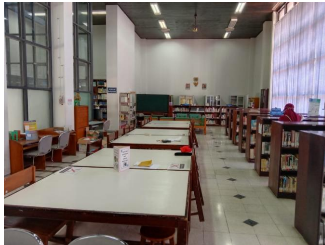
Gambar 2. Pengukuran kebisingan dengan SPL Meter

Untuk mengetahui tingkat kebisingan dari perpustakaan, diletakkan SPL Meter ditengah perpustakaan. Dari sini akan dicatat kegiatan-kegiatan yang terjadi di perpustakaan yang menyebabkan perubahan nilai dari SPL Meter. Dari data ini kemudian diolah untuk diterjemahkan oleh arduino yang telah dilengkapi dengan audio module. Dan apabila nilai kebisingannya telah mencapai batas ambang yang telah diatur, maka audio module akan mengeluarkan bunyi alarm sebagai penanda ruangan tersebut kebisingannya melampaui batas.