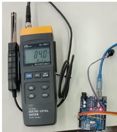
Gambar 5. Pengukuran Kebisingan dengan membandingkan hasil SPL Meter dan Arduino