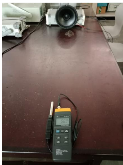
Gambar 4. Pengukuran sinyal sinus dengan posisi cone speaker menghadap SPL Meter