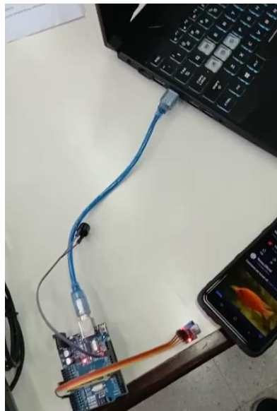
Gambar 6. Modul Arduino dihubungkan dengan Laptop