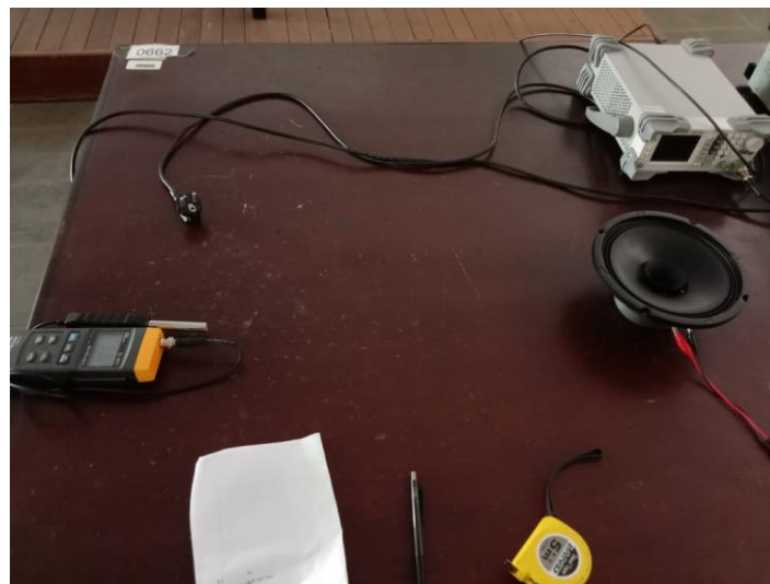
Gambar 3. Pengukuran sinyal sinus dengan posisi cone speaker ke atas