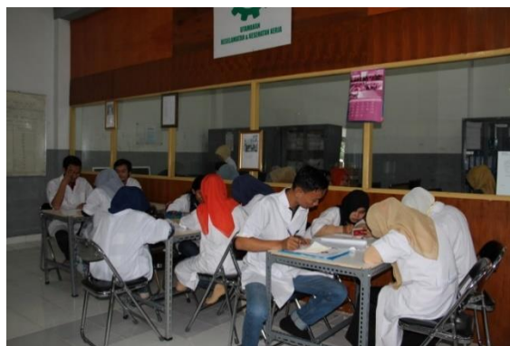
Gambar 5. Pengisian kuisisioner