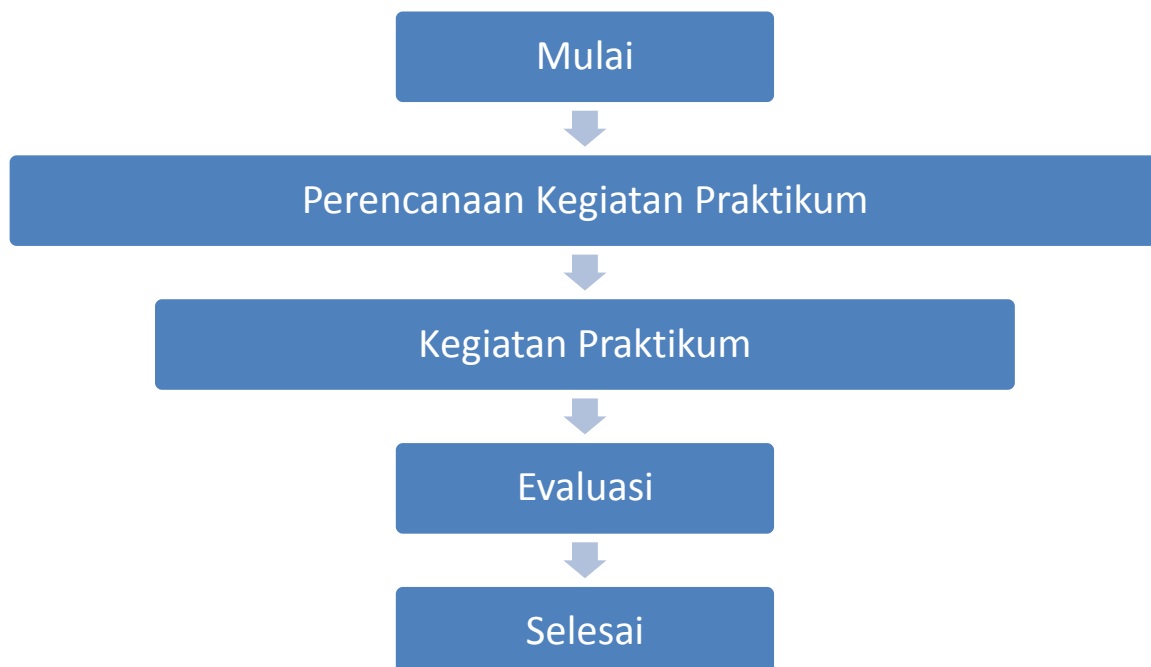
Gambar 1. Kerangka Berfikir

Kuisisioner pengelolaan praktikum pada laboratorium TPSK merupakan salah satu upaya untuk mengetahui kelayakan pelaksanaan kegiatan perkuliahan praktek yang berlangsung pada laboratorium tersebut. Berikut flowchart kerangka pikir penelitian :