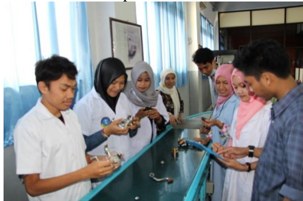
Gambar 4. Kegiatan praktikum

Setiap mengawali kegiatan praktikum Pranata Laboratorium Pendidikan, asisten laboratorium dan mahasiswa melakukan breafing. Tujuan pelaksanaan breafing adalah untuk mengetahui sejauhmana kesiapan pelaksanaan praktikum oleh setiap pengguna laboratorium demi kesehatan dan keselamatan kerja. Setelah selesai serangkaian kegiatan praktikum hingga ujian praktikum berakhir mahasiswa diberikan kuisisioner terkait pengelolaan dan pelayanan laboratorium TPSK. Berikut dokumentasi praktikum mahasiswa :