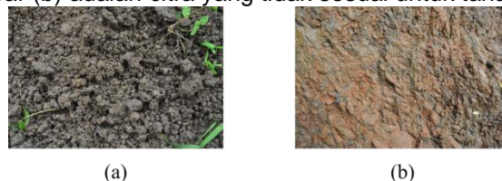
Gambar 2. Hasil Akuisisi Citra

Tahapan awal penelitian ini adalah akuisisi citra, tahapan ini menghasilkan citra tanah sejumlah 50 citra dengan pembagian 25 citra tanah yang sesuai untuk tanaman cengkeh dan 25 citra tanah yang tidak sesuai berdasarkan pakar. Citra yang dihasilkan dari tahapan ini berukuran 4288 x 2848 piksel dengan format *JPG. Gambar 2 merupakan beberapa hasil proses akuisisi citra tanah. Gambar (a) adalah citra tanah yang sesuai untuk tanaman cengkeh berdasarkan pakar, sedangkan gambar (b) adalah citra yang tidak sesuai untuk tanaman cengkeh.