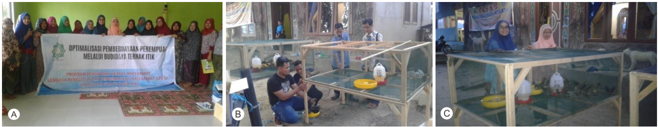
Gambar 5. (A). Peserta Workshop Budidaya Ternak Itik, (B)-(C). Pembuatan Kandang Box Pembesaran (Untuk itik sampai umur 21 hari).

Selanjutnya juga dilakukan praktek pembuatan kandang pembesaran. Kandang berguna sebagai tempat itik bernaung dari segala macam keadaan cuaca, seperti panas, hujan dan terpaan angin. Kandang juga berfungsi sebagai tempat bermain dan bersosialisasi itik karena itik merupakan ternak yang senang hidup berkelompok. Untuk itu perlu dibuat kandang yang nyaman dan dapat memenuhi kehidupan itik tersebut (Gambar 5.B-C).