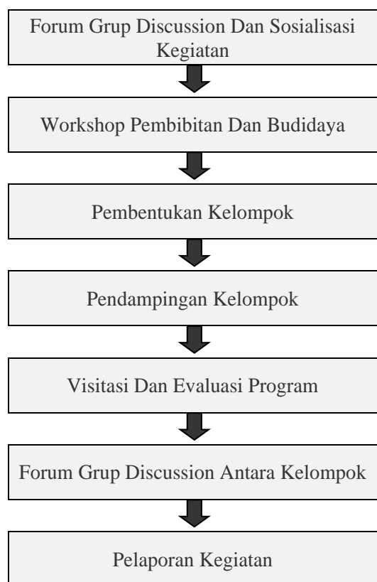
Gambar 1. Tahapan kegiatan pengabdian masyarakat.

Tahapan pelaksanaan pengabdian masyarakat disajikan pada Gambar 1.