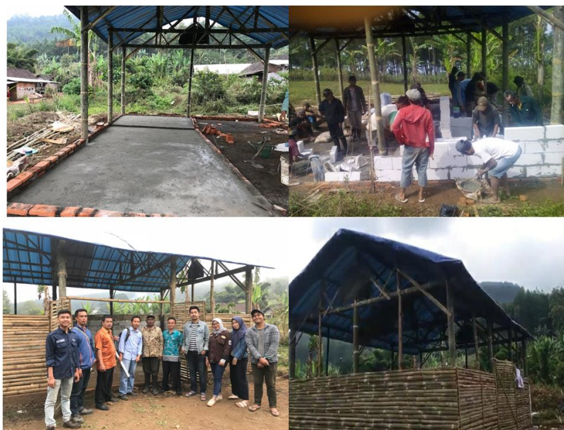
GAMBAR 4. Pembuatan rumah produksi pupuk organik granule (POG) bersama-sama dengan petani pesanggem di UB Forest wilayah Sumberwangi.

Pembuatan rumah produksi POG (Gambar 4) dilakukan mulai bulan Juli sampai dengan Agustus 2018. Lamanya proses pembuatan rumah POG lebih disebabkan karena: 1) kegiatan gotong royong petani pesanggem di UB forest di dalam membuat rumah produksi POG hanya bisa dilakukan setiap hari minggu karena kesibukan petani di dalam mengurus lahan dan mencari pakan ternak, 2) adanya pengecoran lantai untuk tempat pengomposan memerlukan waktu yang agak lama hingga benar-benar kering, dan 3) adanya perubahan desain rumah produksi POG yang awalnya hanya dari bambu menjadi bata ringan pada sebagian dindingnya.