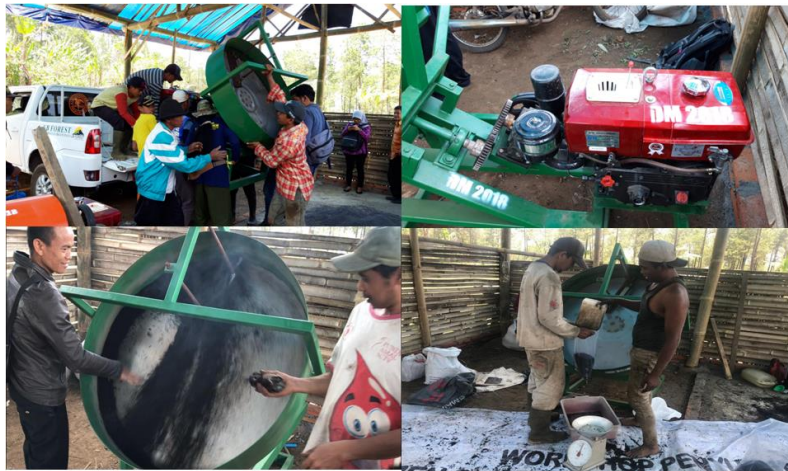
GAMBAR 5. Mesin granulator yang diserahkan-terimakan kepada petani pesanggem UB forest Sumberwangi untuk pembuatan pupuk organik granule (POG) dan pendampingan pengoperasiannya.

dan tinggi 150 cm, berat alat 86 kg, penggerak diesel 8 HP/2600 RPM dengan menggunakan bahan bakar solar karena listrik di dalam wilayah UB forest sangat terbatas.