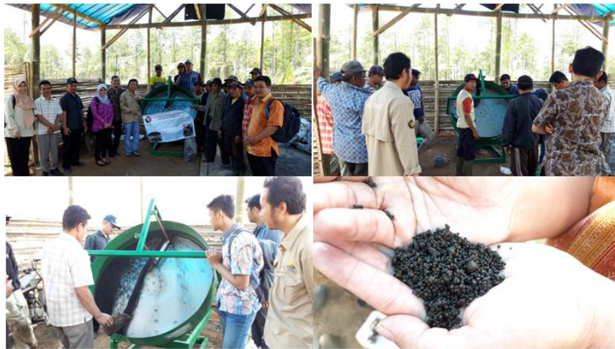
GAMBAR 3. Kegiatan pelatihan pembuatan pupuk organik granule (POG) di Universitas Brawijaya dan di UBF Sumberwangi.