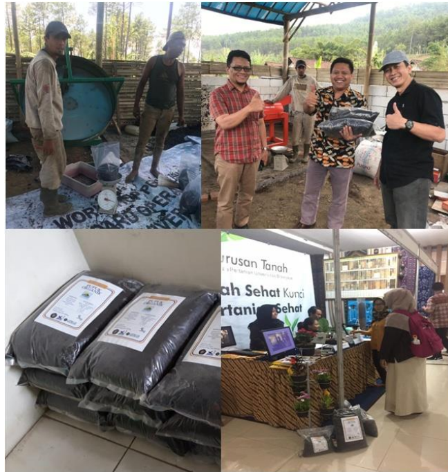
GAMBAR 6. Kompos yang sudah dikemas dipasarkan di Depo Fakultas Pertanian Universitas Brawijaya dan ditampilkan dalam bazar Dies Natalis Fakultas Pertanian Universitas Brawijaya.

Kompos dan POG yang dibuat sampai dengan saat ini masih sedikit karena proses pembuatan kompos sebagai bahan baku POG berjalan agak lama ( \pm 1 bulan) dan kompos yang sudah jadi dipasarkan dalam bentuk halus dan POG. Kompos yang sudah jadi dikemas dengan ukuran 3 kg dan dipasarkan di Depo Fakultas Pertanian Universitas Brawijaya dengan harga Rp. 10.000 per 3 kg. Untuk lebih mempromosikan POG kulit buah kopi yang dihasilkan, produk POG kulit buah kopi yang dibuat ditampilkan pada acara Bazar dan gelar teknologi hasil penelitian dan pengabdian masyarakat dalam rangka Dies Fakultas Pertanian Universitas Brawijaya pada tanggal 4-11 November 2018 (Gambar 6).