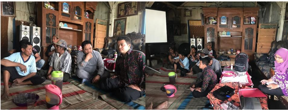
GAMBAR 2. Penyuluhan mengenai kompos dan pupuk organik granul (POG) dan pertanian organik kepada petani pesanggem di UB Forest.

Kegiatan sosialisasi dan penyuluhan mengenai kompos dan POG serta penerapannya di dalam pertanian organik dilakukan pada tanggal 30 Juni 2018 dengan peserta petani pesanggem yang tinggal di dalam wilayah UB forest (Gambar 2). Materi yang diberikan meliputi teknologi pembuatan POG, manfaat POG dari sisi ekonomi, lingkungan, tanah/tanaman, dan POG yang berkualitas bagus. Hasil dari kegiatan sosialisasi dan penyuluhan adalah adanya minat yang besar dari petani pesanggem (100% dari peserta penyuluhan) untuk bisa memproduksi kompos dan POG bukan hanya dari bahan baku residu kulit kopi tetapi akan dikembangkan juga untuk bahan-bahan/residu sisa panen dan atau kotoran ternak. Selain itu, hasil kegiatan penyuluhan adalah adanya rencana dari masyarakat untuk menerapkan sistem pertanian organik di dalam budidaya kopi di UB forest melalui pemberian POG yang dihasilkan. Untuk jangka pendek, petani pesanggem meminta agar POG yang dihasilkan perlu diuji terlebih dahulu kandungan unsur haranya serta diujikan ditanaman agar bisa mengetahui kualitasnya.