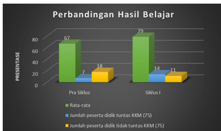
Gambar 3 Diagram Perbandingan Hasil belajar Pra Siklus dan Siklus I

Rata-rata hasil peserta didik pada pra siklus adalah 67, dan siklus I adalah 79. Jumlah peserta didik yang tuntas KKM pada pra siklus adalah 7, dan siklus I terdapat 14 peserta didik. Maha ini membuktikan adanya peningkatan hasil pembelajaran menggunakan media interaktif Phet Colorado .