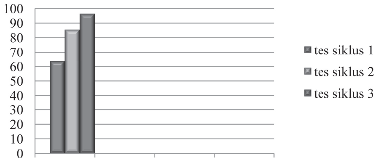
Gambar 1 Grafik Peningkatan Aktivitas Guru Dalam Proses Pembelajaran

berbasis kisah, 2). Melalui penerapan metode kisah guru lebih mudah menjalin hubungan batin maupun emosional dengan peserta didik, 3). Guru menjadi lebih mudah dalam pengelolaan kelas, sehingga suasana kelas lebih kondusif dan produktif serta menyenangkan.