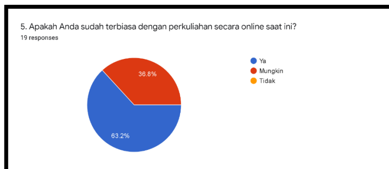
Gambar 2. Respon Pertanyaan Poin 5

Pada poin pertanyaan kelima tentang apakah mahasiswa sudah merasa terbiasa dengan pembelajaran daring, didapat hasil bahwa 63.2% responden mahasiswa yang mengaku bahwa mereka sudah terbiasa dengan pembelajaran daring. Ada pula 36.8% responden mahasiswa lain yang menjawab mungkin dan tidak ada satu pun yang menjawab tidak terbiasa dengan pembelajaran daring.