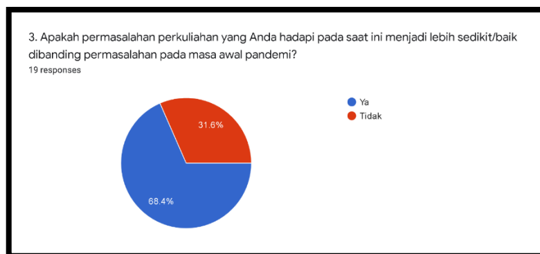
Gambar 1. Respon Pertanyaan Poin Ketiga

Pada poin pertanyaan ketiga tentang apakah permasalahan yang ada di dalam pembelajaran menjadi lebih baik seiring berjalannya waktu, didapat hasil bahwa 68.4% responden mahasiswa yang mengaku permasalahan yang mereka hadapi akhir-akhir ini menjadi lebih baik dibanding dengan sebelumnya saat awal pembelajaran daring. Ada pula 31.6% responden mahasiswa lain yang merasa bahwa tidak ada kemajuan dalam berkurangnya permasalahan pada pembelajaran daring.