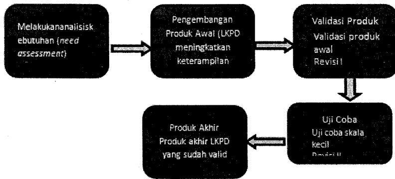
Gambar 1. Prosedur Pengembangan Penelitian, diadaptasi dari Borg & Gall