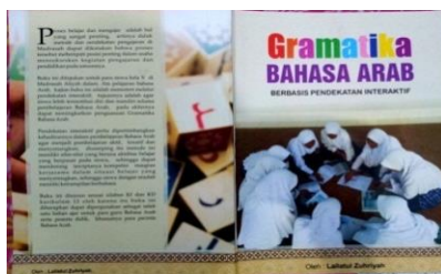
الصورة ١: قوالب الكتاب :

تم تطوير الكتاب باستخدام بالمدخل التفاعلي الذي يكمل ألعاب قواعد العربية استخدامه لسهولة فهم التعليمية الفريحة. يستخدم عرض المواد على هذا المنتج طريقة استنتاجية وكذا يتم تعبئتها مع نموذج رسم الخرائط الذهنية. ويوجد في كل فصل فراغي من المادة أنواع التدريبات تغطي المادة. وفيما يلي العرض على شاشة الكتاب النحو المطور بالتفاعلي: