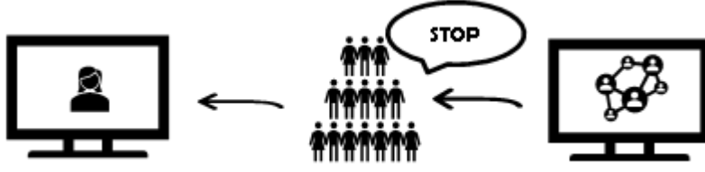
الصورة ٢ تصور نشاط عرض

٤. تتقدم الخريجة التي تم اختيارها إلى المنصة.