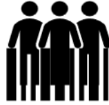
الصورة ٤ تصور نشاط عرض الكتاب

٥. تكرر الخطوات ١-٣ حتى يكون لدينا ٣-٥ مرشحين مختارين من كل كتاب أو مستوى.