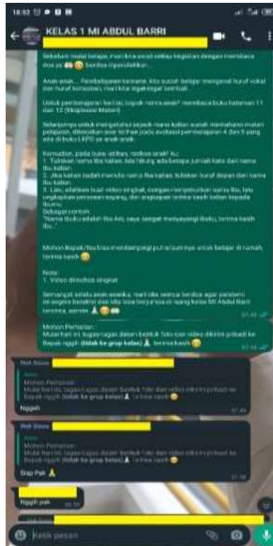
Gambar 2. Proses pembelajaran daring dengan memanfaatkan aplikasi Whatsapp

atau pesan suara ( voice note ). Whatsapp juga digunakan guru untuk menerima hasil tugas dari peserta didik yang nantinya akan diproses oleh guru.