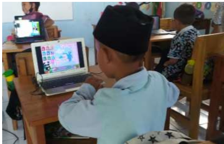
Gambar 3. Pembelajaran ekstrakurikuler menggunakan perangkat laptop di Madrasah Ibtidaiyah Abdul Barri

Pembelajaran TIK di MI Abdul Barri dilaksanakan dengan tujuan untuk mengenalkan dan mengajarkan pentingnya pembelajaran dengan memanfaatkan teknologi informasi dan komunikasi. Kemudian, dengan adanya pembelajaran TIK di sekolah, anak-anak diharapkan lebih produktif dan mandiri dalam melaksanakan pembelajaran daring. Peserta didik yang tadinya asing dengan teknologi informasi diarahkan agar tidak lagi kesusahan apabila dilaksanakan pembelajaran dengan perangkat elektronik seperti handphone atau laptop.