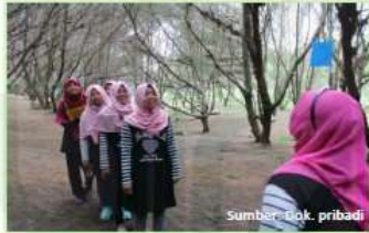
Gambar 1.3 Peserta menebak unsur/senyawa di bando yang dipakai