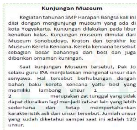
Gambar 2. Guided note taking

Guided note taking pada produk ini ditujukan untuk menilai beberapa aspek penilaian sikap dan juga penilaian kognitif. Guided note taking disajikan dalam bentuk cerita pendek yang berhubungan dengan materi yang disampaikan di tiap pos. Cerita tersebut dibacakan oleh instruktur secara keseluruhan dan peserta outbound melengkapi bagian kosong dalam cerita. Penerapan guided note taking dan outbound sains pada buku dapat dilihat pada Gambar 2 dan Gambar 3 .