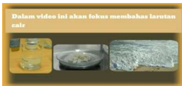
Gambar 3. Tampilan gambar

Halaman pengenalan larutan yang berisi tentang penampilan gambar dan jenis larutan berdasarkan kemampuan menghantarkan listrik beserta contoh gambar.