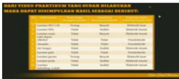
Gambar 6. Pembahasan praktikum

Halaman berisi tentang pembahasan praktikum yang telah dilakukan dalam video sebelumnya.