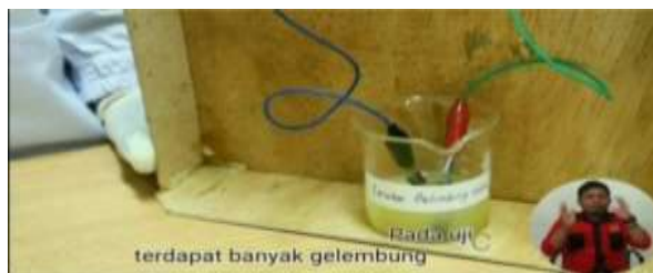
Gambar 5. Video Praktikum dengan close caption dan bahasa isyarat

Halaman berisi tentang pembahasan praktikum yang telah dilakukan dalam video sebelumnya.