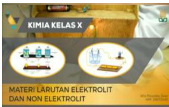
Gambar 1. Halaman utama

Halaman utama, bertuliskan Kimia Kelas X dan "Materi Larutan Elektrolit dan Nonelektrolit" dengan tujuan untuk mengetahui materi yang akan dibahas dalam media "VIP RUNGU" tersebut.