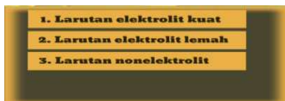
Gambar 4. jenis larutan

Halaman berisi tentang video praktikum yang dilengkapi dengan bahasa isyarat dan close caption .