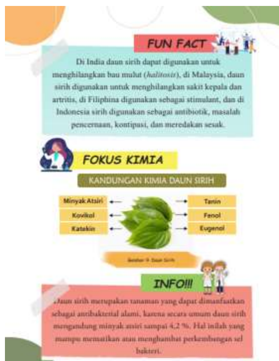
Gambar 4. Informasi Mengenai Daun Sirih dalam Buku Bacaan