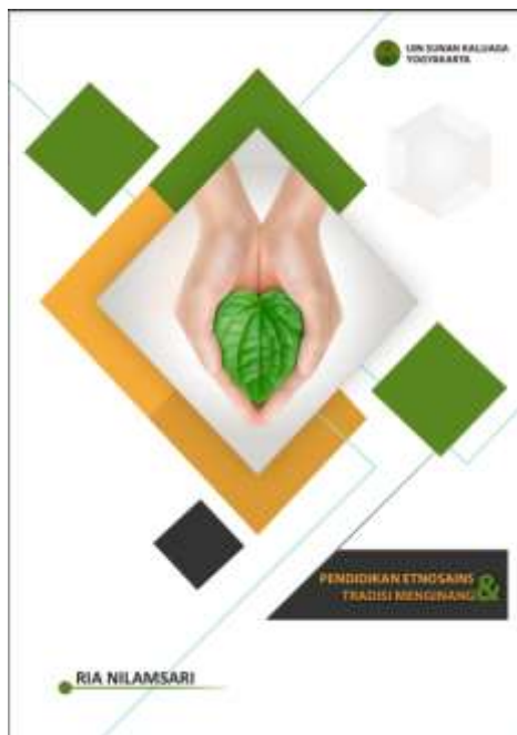
Gambar 2. Halaman Judul

Tahap penyusunan desain awal dilakukan penyusunan buku bacaan dalam bentuk media cetak yang dapat dijadikan sebagai referensi literasi sains oleh siswa. Proses pengembangan yang dilakukan adalah sebagai berikut.