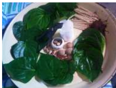
Gambar 7. Ramuan Pokok dan Pelelengkap Menginang

Disajikan juga dalam buku bacaan proses menginang yaitu sebagai berikut.