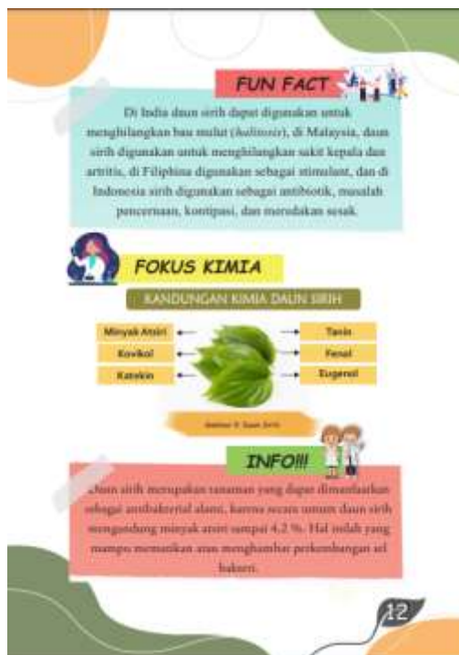
Gambar 3. Contoh Informasi Budaya Tradisi Menginang yang dikaitkan dengan Sains