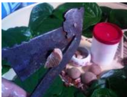
Gambar 8. Pemotongan Buah Pinang