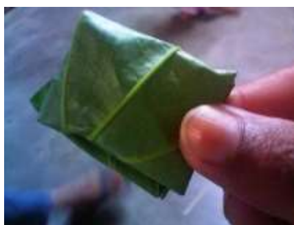
Gambar 10. Pelipatan Daun Sirih untuk Siap Disajikan

Setelah proses pembuatan buku bacaan selesai, produk di validasi yang bertujuan untuk mengetahui kualitas dan validitas muatan materi pada buku bacaan sehingga jika produk telah memiliki kualitas yang baik maka dilanjutkan ke tahap selanjutnya. Produk di validasi oleh Dosen ahli materi yaitu Setia Rahmawan, M.Pd., aspek penilaian oleh ahli materi meliputi aspek kelayakan isi materi, kebahasaan, dan etnosains. Data hasil validasi ahli materi dapat dilihat dari Tabel 1.