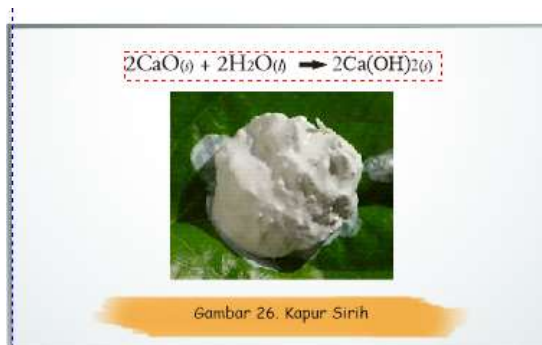
Gambar 6. Informasi Mengenai Kapur Sirih dalam Buku Bacaan

Disajikan juga dalam buku bacaan proses menginang yaitu sebagai berikut.