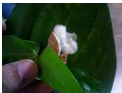
Gambar 9. Peletakkan Kapur, Pinang, dan Gambir di atas Daun Sirih