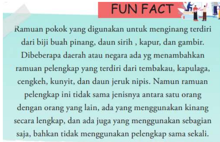
Gambar 3. Contoh Informasi Fakta Tradisi Menginang dalam Buku Bacaan