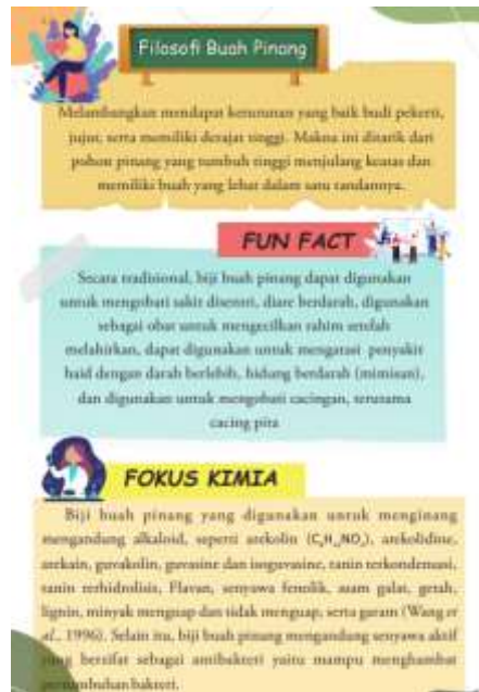
Gambar 5. Informasi Mengenai Biji Buah Pinang dalam Buku Bacaan