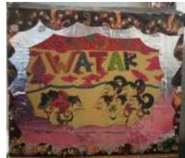
Gambar 5. Kotak KIT

Produk yang telah selesai dikembangkan menjadi WATAK (wayang kertas kimia) dikonsultasikan ke dosen pembimbing untuk mendapatkan masukan. Selanjutnya produk divalidasi oleh tiga ahli yaitu ahli materi, ahli media dan ahli budaya. Ahli materi dan ahli media ini memberikan penilaian sesuai dengan aspek yang dinilai dalam instrumen. Ahli budaya tidak diberikan lembar penilaian khusus. Hal ini dikarenakan untuk memperluas saran dan masukan tanpa adanya batasan bagi ahli budaya dan juga topik budaya yang cukup sensitif sehingga akan mempersulit ketika ada batasan aspek apa saja yang dinilai. Hasil penilaian produk oleh ahli media dapat dilihat pada Tabel 2.