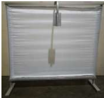
Gambar 4. Kelir dan senter