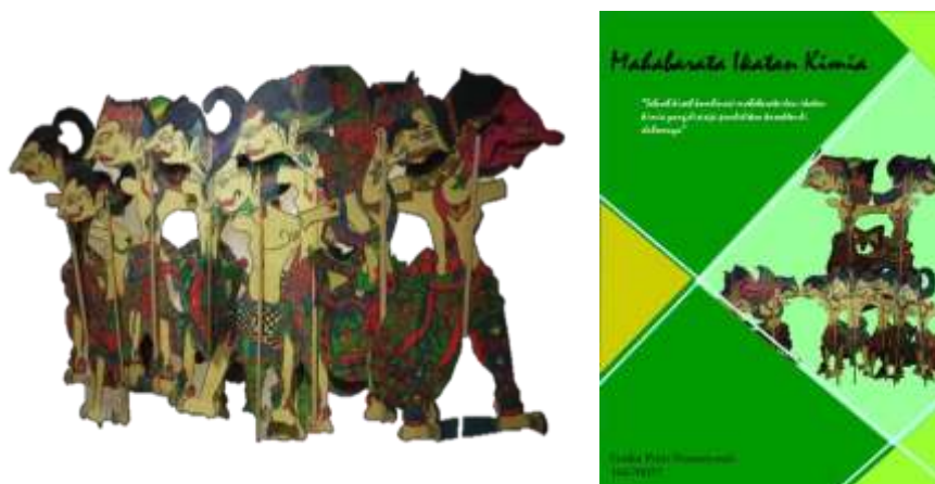
Gambar 1. Desain WATAK dan naskah mahabarata ikatan kimia

Media ini WATAK ini terdiri dari wayang kertas kimia, kartu ikatan kimia, lembar informasi WATAK, kelir, dan kotak KIT. Wayang kertas kimia (WATAK) berukuran 25 x 10 cm, dengan tokoh-tokoh yang terdiri dari Widura, Pandawa lima (Yudhistira, Bima, Arjuna, Nakula dan Sadewa), Drupadi, Sengkuni dan Duryudana. Tokoh wayang kertas kimia dibuat peyangga agar dapat dimainkan seperti wayang pada aslinya. Naskah mahabarata ikatan kimia yang disajikan dalam dialog pewayangan yang telah dikombinasikan dengan materi ikatan kimia, mahabarata dan pendidikan karakter didalamnya serta visual dari kartu ikatan kimia. Desain WATAK dan naskah mahabarata ikatan kimia dapat dilihat pada Gambar 1.