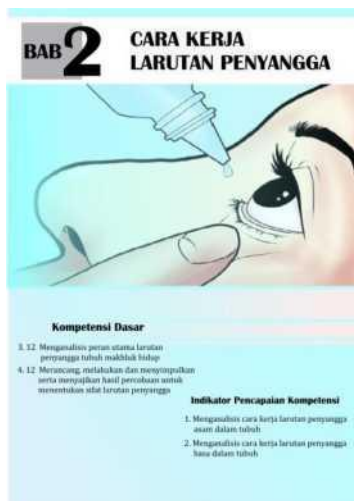
Gambar 2. Salah satu tampilan sub materi dalam modul kimia berbasis CORE

Bagian awal modul kimia terdiri dari kata pengantar, karakteristik modul berbasis model CORE, dan daftar isi. Bagian isi modul kimia berbasis CORE ini terdiri dari uraian materi, informasi setiap bab, aspek CORE, kunci jawaban, dan rangkuman. Uraian materi pada produk ini terdiri dari empat subbab yaitu pengertian larutan penyangga, cara kerja larutan penyangga, menghitung pH larutan penyangga dan fungsi larutan penyangga dalam tubuh. Salah satu tampilan sub materi dalam modul kimia berbasis CORE dapat dilihat pada Gambar 2.