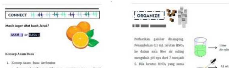
Gambar 3. Salah satu tampilan aspek CORE dalam modul

Informasi setiap bab, berisi informasi awal tentang bab yang akan dipelajari mencakup kompetensi dasar, indikator pencapaian, tujuan pembelajaran dan pengantar awal bab. Aspek model CORE dalam modul terdiri dari empat aspek yaitu Connecting, Organizing, Reflecting dan Extending. Salah satu tampilan aspek CORE dalam modul dapat dilihat pada Gambar 3.