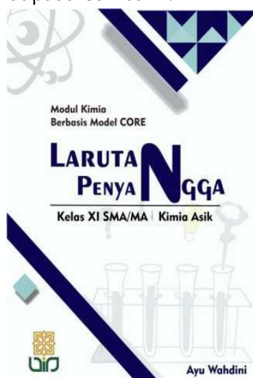
Gambar 1. Halaman sampul modul kimia berbasis CORE

Tahap develop dilakukan dengan mengembangkan produk, validasi modul kimia oleh ahli materi dan ahli media, penilaian media oleh pendidik kimia, serta respon peserta didik. Produk yang dikembangkan berupa modul kimia berbasis model CORE materi larutan penyangga kelas XI SMA/MA yang berisi empat sub materi, dimana disetiap sub materi terdapat empat aspek model CORE. Halaman sampul modul kimia ini berisi judul modul, kelas, nama penulis gambar pendukung, kata motivasi dapat dilihat pada Gambar 1.