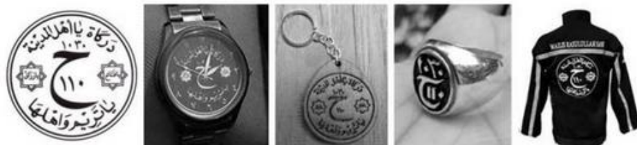
Gambar 3: Kalimat Bacaan Ya Tarim Wa Ahlaha diberbagai media

Bacaan Ya Tarim wa Ahlaha tidak hanya dibacakan dalam aktifitas keagamaan, akan tetapi kalimat bacaan ini bertransformasi ke dalam barang yang bersifat personal. Berikut cuplikannya;