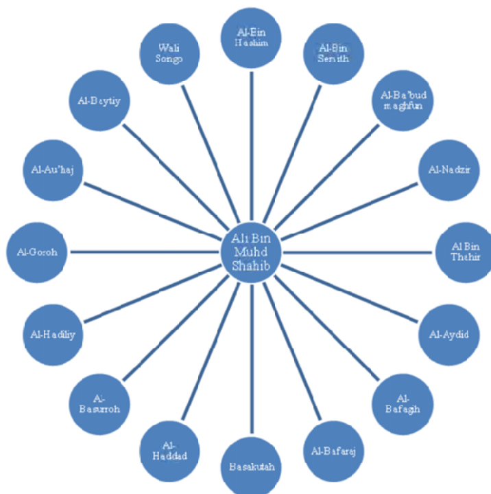
Rajah 1. Silsilah dari keturunan Alwi bin Muhd Shahib Marbad

keturunan melalui keturunan Ahmad bin Isa al-Muhajir masih boleh dijejaki sehingga hari ini (R.B. Serjeant, 1949: 282-307). 10 Keturunan yang digelar Alawiyyin ini dimulakan oleh anak cucu Alwi bin Ubaidillah yang terakhir bernama Muhammad Shahib Marbad dan anaknya yang bernama Alwi dan Ali (Muhammad Hasan Aidid,1999: 19). 11 Alwi bin Muhammad Shahib Marbad misalnya, menurunkan keturunan Alawiyyin yang bergelar;