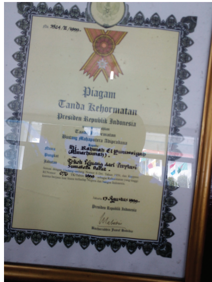
Gambar 1.6 Piagam Kehormatan dari B.J Habiebie