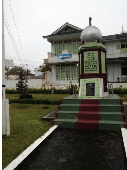
Gambar1.4 Tugu peringatan 25 tahun dan 50 tahun perguruan Diniyyah Putri