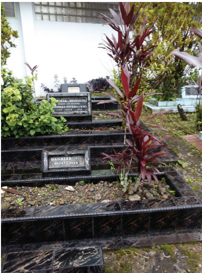
Gambar 1.5 Makam Rahmah El Yunusiyah di Padang Panjang