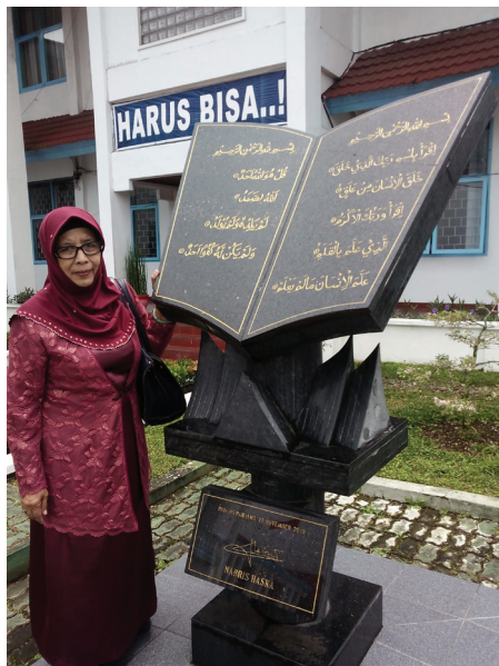
Gambar 1.1 monumen pendorong semangat siswa

tanpa pamrih. Ia telah merealisasikan cita-cita Ibu Kartini, Dewi Sartika dan Cut Nyak Dien serta cita-cita bapak kebangkitan Nasional kita Dr. Wahidin Sudirohusodo. Berbagai macam gelar yang di berikan masyarakat kepadanya, misalnya Kartini dari perguruan Islam, Pendidik Wanita Islam, Pejuang Wanita Islam Indonesia, Kartini Gerakan Islam , dan sebagainya. Ia lebih beruntung dari ibu Kartini dan Cut Nyak Dien, Karena ia dapat menghayati apa yang ia perjuangkan selama ini, sehingga dapat di sempurnakannya sesuai dengan cita-citanya. Ia dapat merasakan betapa pahitnya penderitaan kaum wanita di masa penjajahan Belanda dan Jepang, sehingga berjuang untuk mewujudkan mimpi-mimpinya untuk menyadarkan wanita akan kedudukannya, sehingga dengan alam merdeka dapat bergerak dengan bebas, dan dapat melihat ada kaumnya yang menjadi Menteri, pemimpin masyarakat, pemimpin agama, dan semua aspek kehidupan masyarakat kaum wanita ada disana. Inilah salah satu kebanggaannya dan kebahagiaan yang ia dapat rasakan sebelum nafas terakhir meninggalkan jasadnya, menuju Khalik penciptanya.