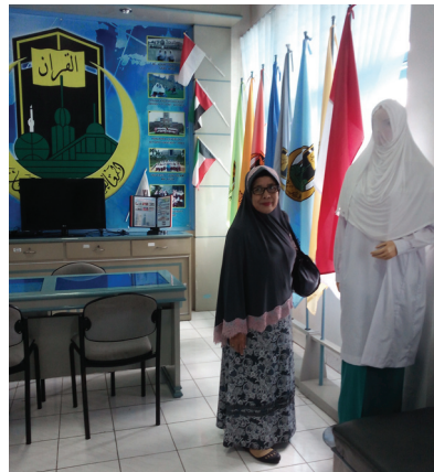
Gambar 1.3 Lambang Sekolah Diniyah Putri yang di pasang di pintu masuk sekolah

Lambang sekolah ini memiliki arti sebagai berikut: